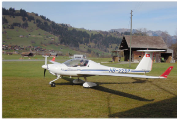
Die zweisitzige Super-Dimona eignet sich gut für einen Schnupperflug als Einzelperson.

Grundsätzlich können Sie Ihren Rundflug nach Ihrer Wahl zusammenstellen. Der Preis beträgt CHF 5.50 pro Flugminute. Auf der Rückseite finden Sie unsere Routen-Vorschläge.