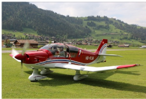
In der viersitzigen Robin haben neben Ihnen noch zwei weitere Passagiere Platz, denen Sie eine Freude machen können. Der Preis bleibt der gleiche!