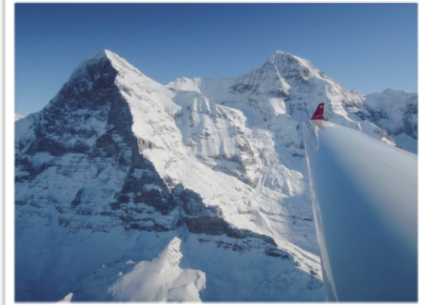
Ein Alpenrundflug ab Zweisimmen ist ein phantastisches Erlebnis! Hier mit der Super Dimona vor Eiger, Mönch und Jungfrauoch.